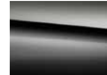
191 cosmos black