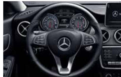
พวงมาลัยมัลติฟังก์ชัน