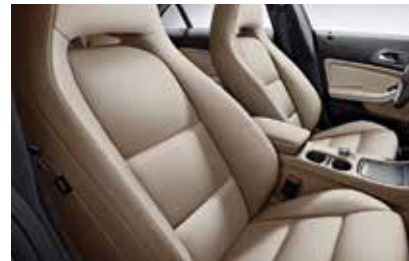
155 ARTICO sports seat sahara beige