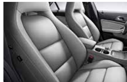
158 ARTICO sports seat crystal grey

*ตัวอย่างสีอาจแตกต่างจากสีจริงของรถ เนื่องจากระบบการพิมพ์ **ภาพใช้เพื่อการโฆษณา โปรดพิจารณารายการอุปกรณ์ของรถยนต์ในตารางท้ายแคตตาล็อกนี้