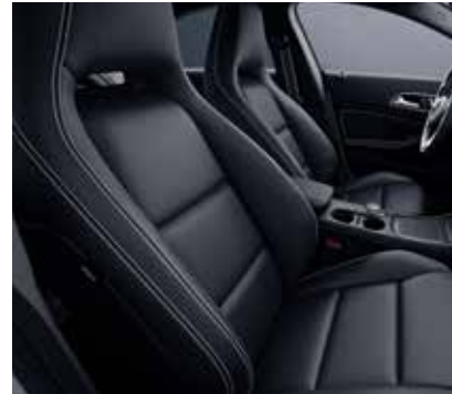
161 ARTICO man - made leather - black