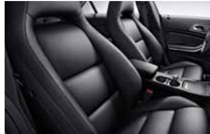
151 ARTICO sports seat black