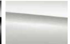
761 polar silver