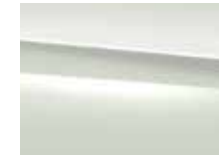
149 polar white