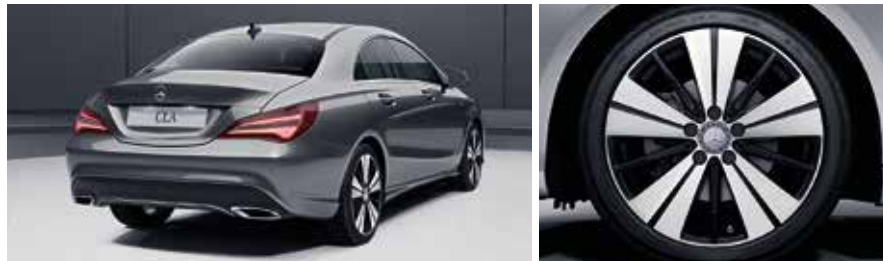
ปลายท่อไอเสียเสริมโครเมียม 2 ท่อ ที่มาพร้อมล้ออัลลอย ขนาด 18" แบบทูโทน