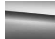
787 mountain grey